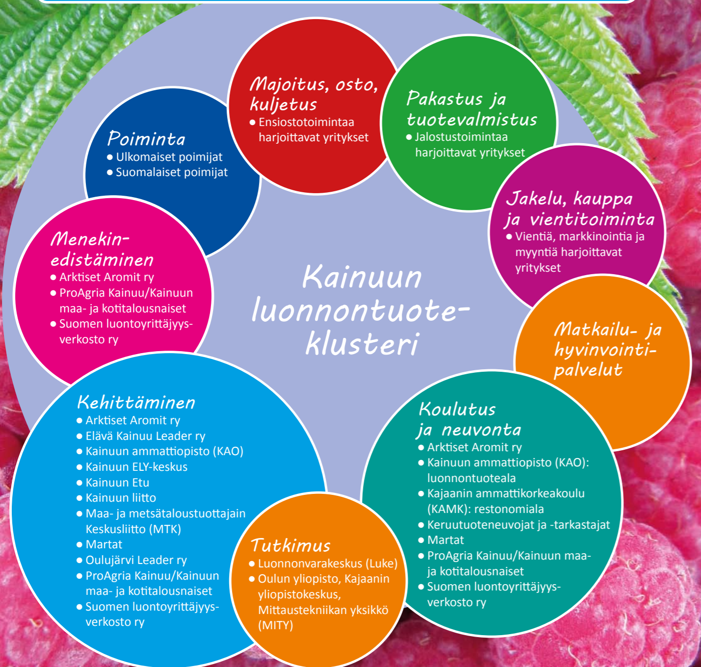
Kuva 2. Kainuun luonnontuoteala kokonaisuutena

Kainuussa on runsaasti luonnontuotteiden ostotoimintaa ja jatkojalostusta harjoittavia yrityksiä. Eniten Kainuusta löytyy marjoja ostavia ja jalostavia yrityksiä, mutta muutama yritys harjoittaa myös sienten ja yrttien kauppaa ja jalostusta. Marjatuotteiden osalta kaupankäynti on jo osalla yrityksistä kansainvälistä. Suurin osa myy jatkojalosteita valtakunnallisesti tiheään asutuissa kaupungeissa, joissa asiakasmäärä on laajempi kuin Kainuussa. Lisäksi useat alueen lei-