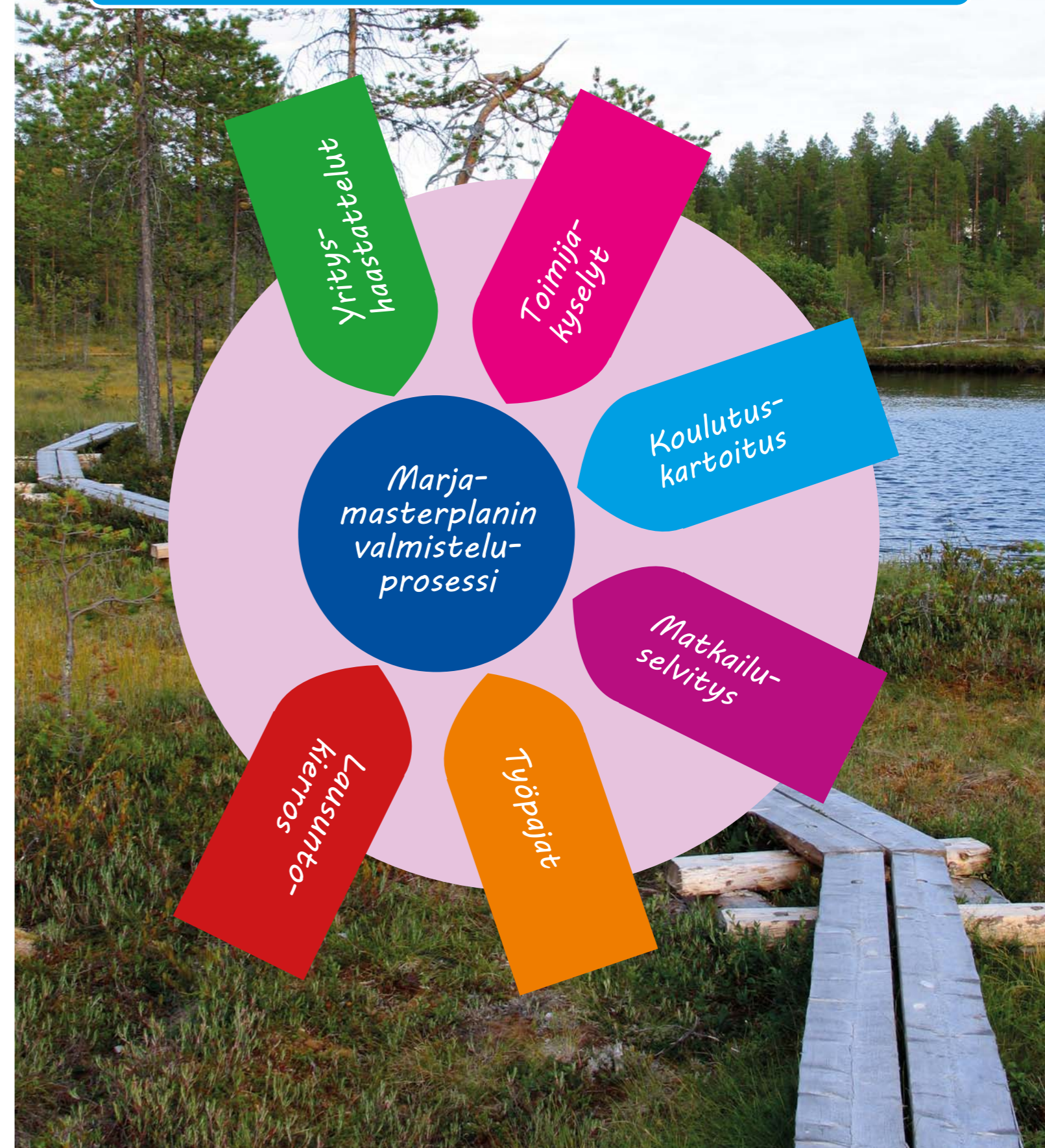
Kuva 1. Kainuun luonnontuotealan masterplan valmisteluprosessi

Lisäksi Kainuun luonnontuotealan kehittämisestä keskusteltiin neljässä työpajatilaisuudessa, joissa käsiteltiin keskeisiä luonnontuotealan teemoja kuten jatkojalostusta, markkinointia, kansainvälistymistä ja teknologiaa. Työpajatilaisuuksissa alan yrittäjät ja muut toimijat pääsivät suunnittelemaan yhdessä alan kehittämistä Kainuussa. Aineistoa masterplaniin saatiin myös koulutuskartoituksesta, jossa selvitettiin, onko luonnontuotealaan liittyvässä koulutustarjonnassa kehittämistarpeita, ja matkailuselvityksestä, jossa kartoitettiin luonnontuotteiden käyttöä matkailuyrityksissä. Lisäksi alan toimijoille annettiin mahdollisuus kommentoida masterplanista. Luonnos masterplanista oli lausuntokierroksella 13.–27.1.2017. Masterplanista saatiin yhteensä 17 lausuntoa, jotka soveltuvin osin on otettu masterplanin viimeistelyssä huomioon.